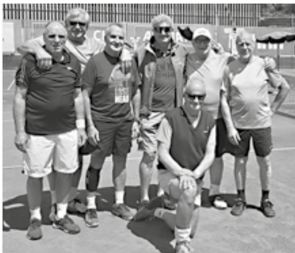
Squadra "giovani" in trasferta ...

Quarto anno di attività della squadra over 65. Malgrado gli anni che avanzano (e gli acciacchi che aumentano) l'entusiasmo non manca.